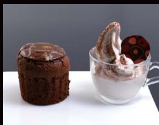
フォンダンショコラ [ソフトクリーム添え]