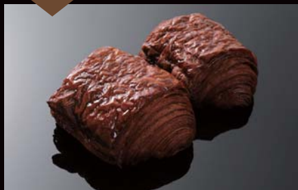
ショコラティエのパン・オ・ショコラ ¥320